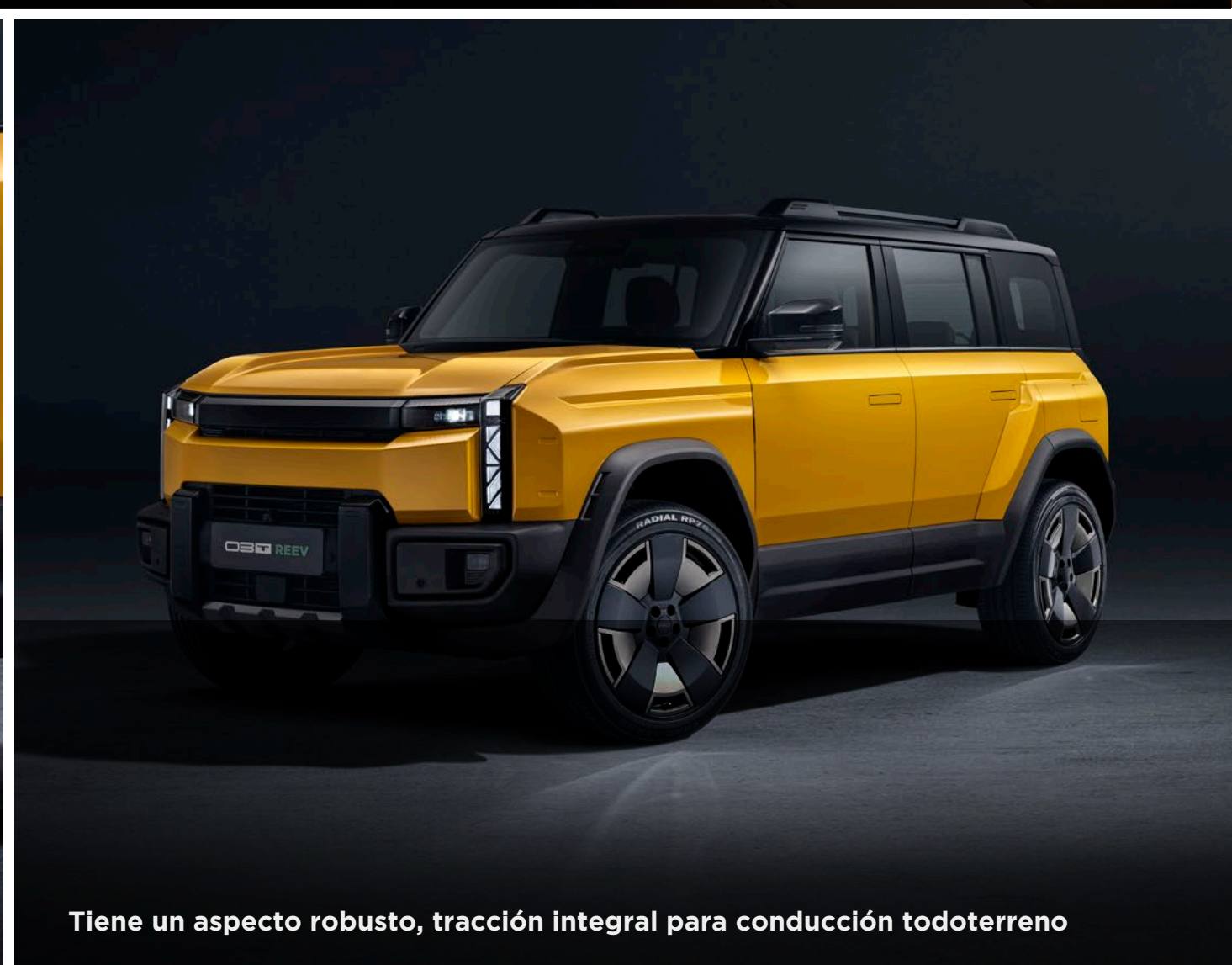
Tiene un aspecto robusto, tracción integral para conducción todoterreno