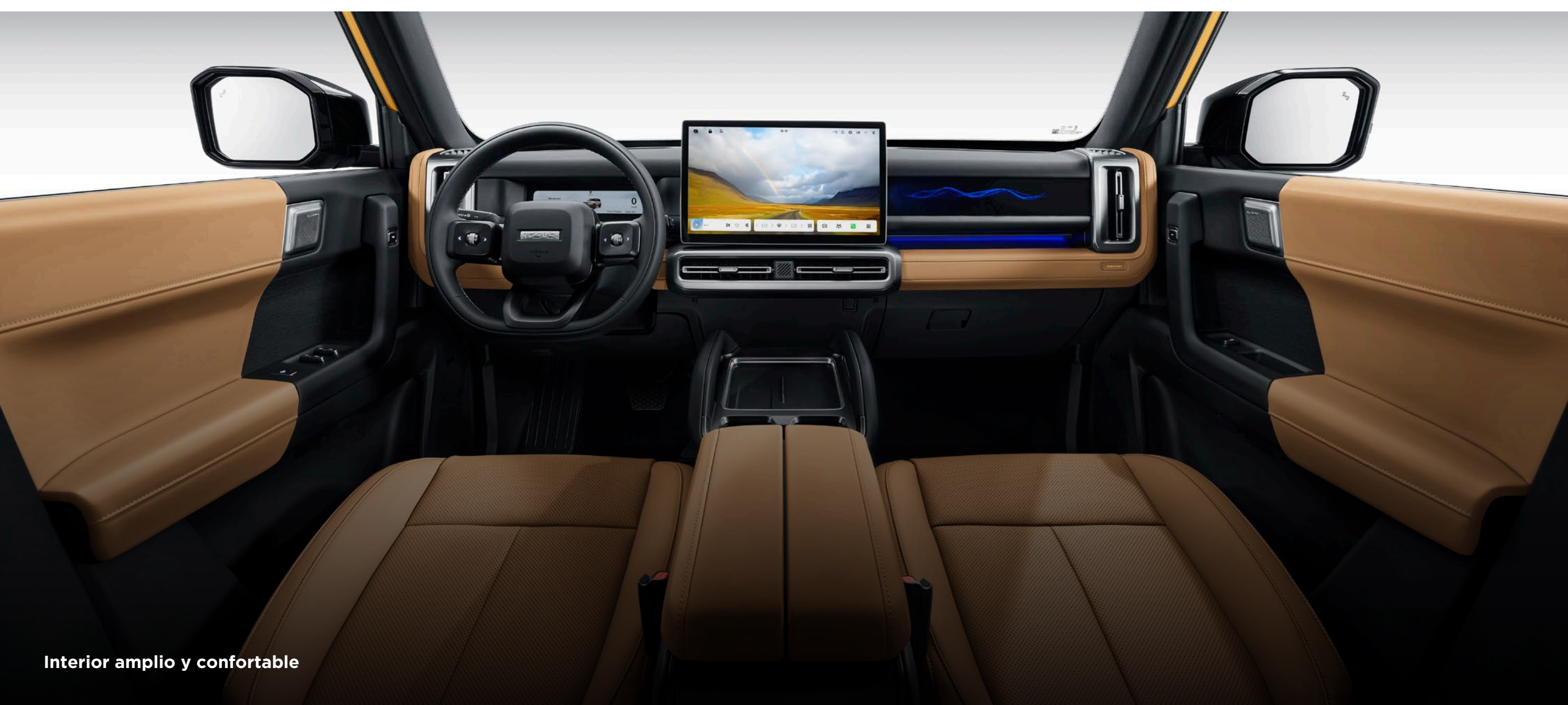
Interior amplio y confortable