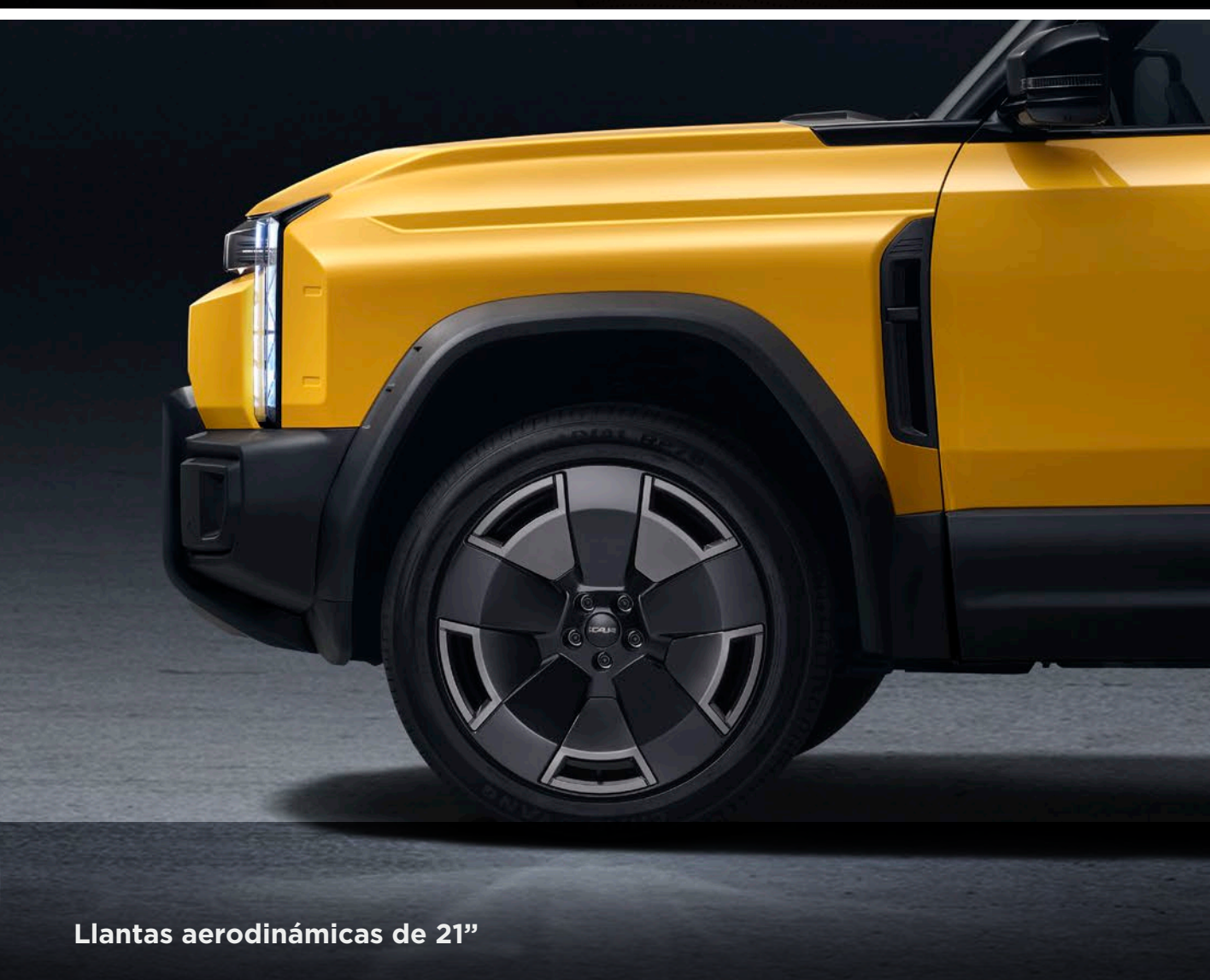
Llantas aerodinámicas de 21"