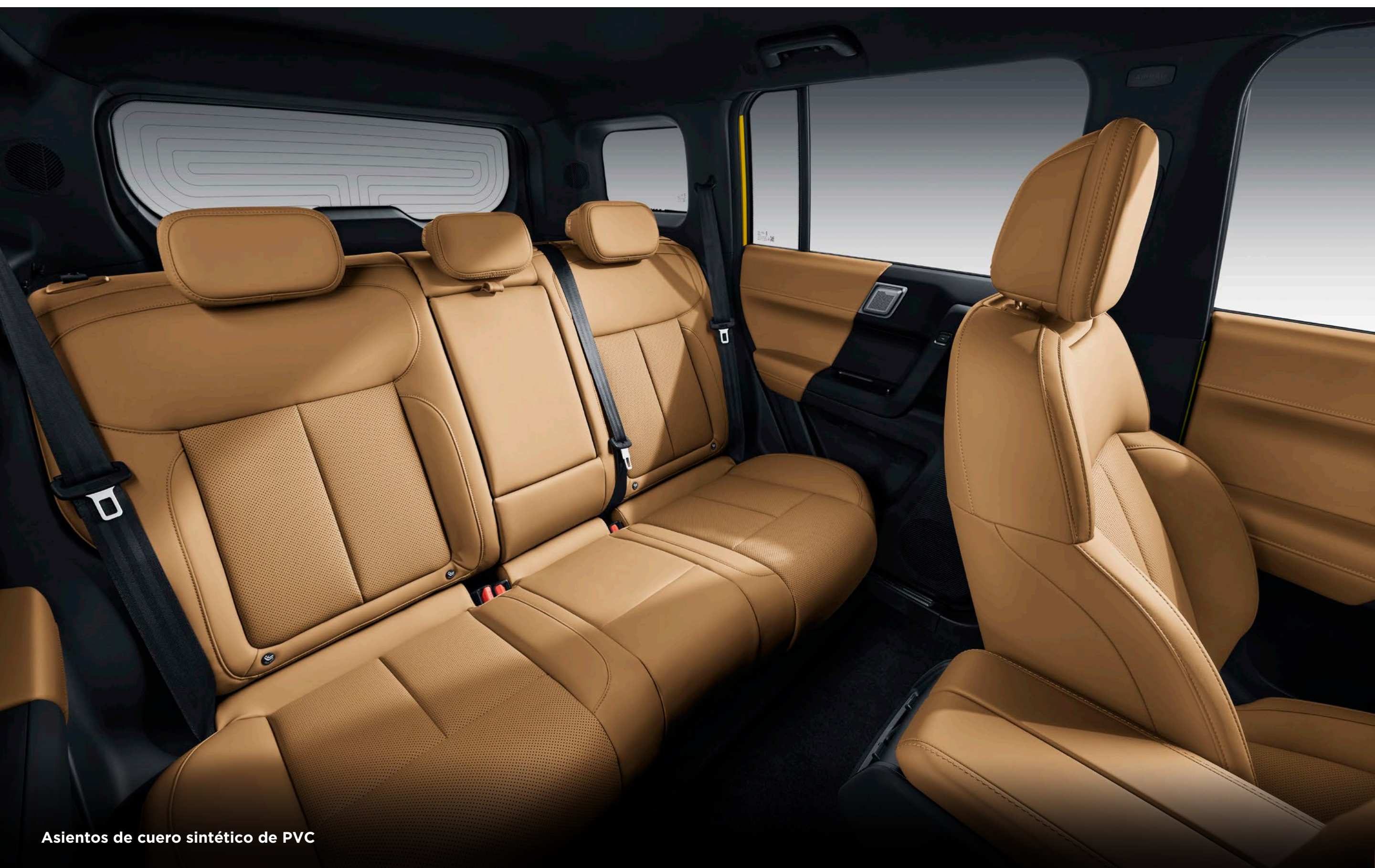
Asientos de cuero sintético de PVC